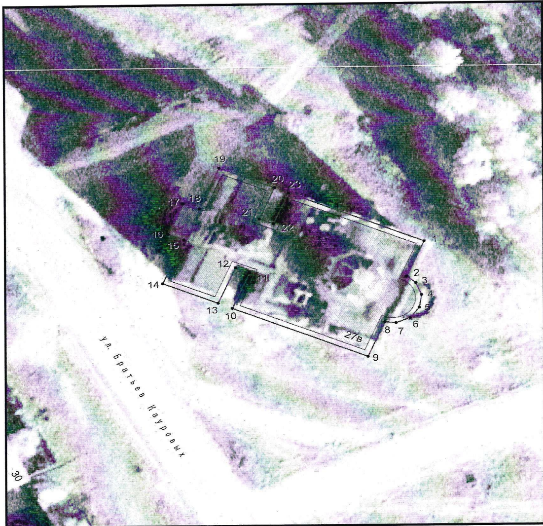
Условные обозначения к плану разбивки границ территории объекта культурного наследия регионального значения «Дмитриевский собор»

1.1. План разбивки границ территории объекта культурного наследия «Дмитриевский собор», расположенного по адресу: Челябинская область, Аргаяшский муниципальный район, село Губернское, улица Братьев Кауровых, 27Г